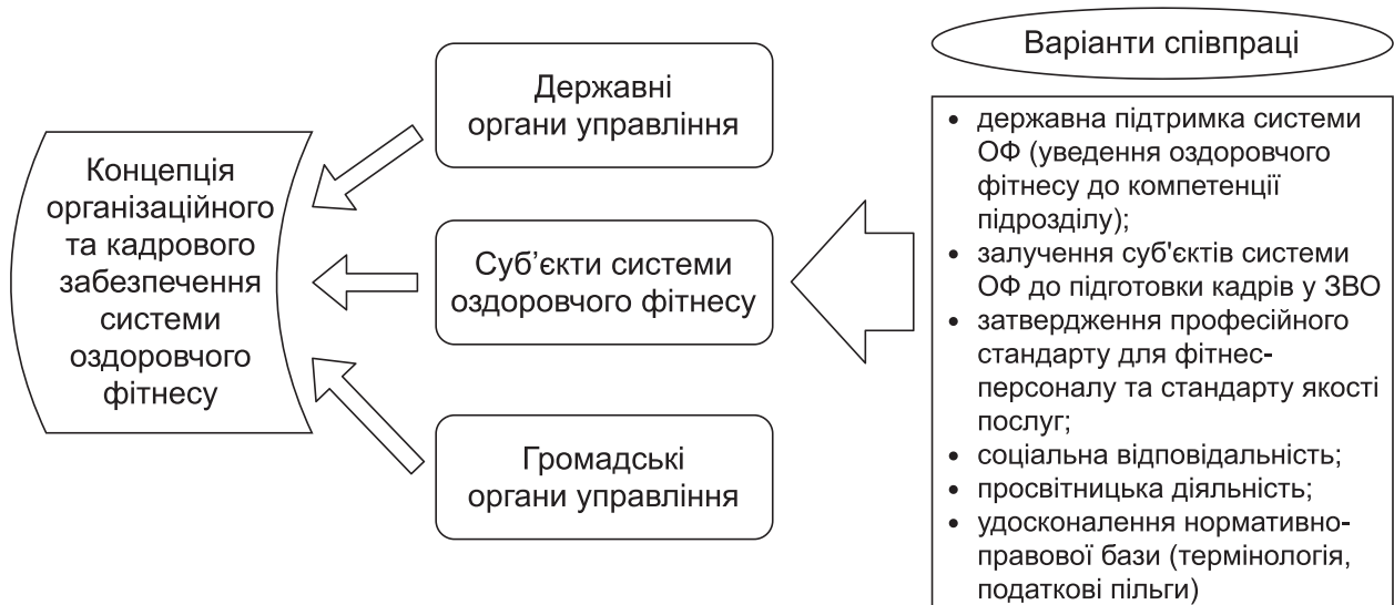
Рис. 1. Схема співпраці суб'єктів сфери фізичної культури і спорту для впровадження Концепції

індустрії фітнесу, визначити стимулювальну та гарантійну роль держави, захистити бізнес та права споживачів. Це дасть можливість визначити повноваження органів виконавчої влади у відносинах із суб'єктами індустрії фітнесу. Бажаним є і прийняття Державної програми підтримки та розвитку оздоровчого фітнесу, яка сприятиме встановленню його ролі та місця в системі оздоровчо-рекреаційної рухової активності.