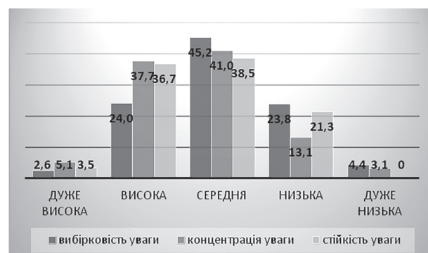
Рис. 2. Кількість студентів (%) з різними рівнями уваги